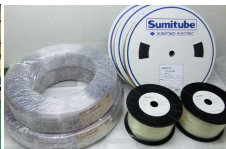
チューブ等切断素材