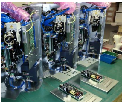
各種ユニット組立